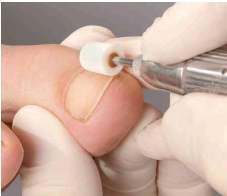
1. Die gründliche Vorbereitung

Wirklich wegweisende Entwicklungen schreiben Erfolgsgeschichte. Die B/S-Spange Classic ist ein ausgezeichnetes Beispiel dafür. Vor mehr als 25 Jahren von Bernd Stolz in Amberg erfunden, hat dieses durchdachte System zur schmerzfreien Korrektur eingewachsener Nägel unzähligen Betroffenen nachhaltig geholfen. Während an der Spange selbst über all die Jahre so gut wie nichts zu optimieren war, sorgt nun der B/S-Aktivator auch bei der Classic-Spange für ein sichereres Aufbringen der Spange auf den Nagel. Grund genug für eine detaillierte Betrachtung dieser sicheren Applikationsmethode.