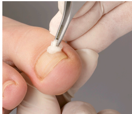
2. Das sorgsame Entfetten