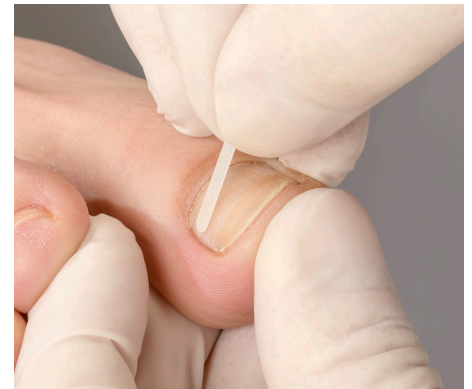
3. Die exakte Anprobe vom Anfang